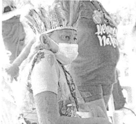
MULHERES pitaguarys debateram sobre violência