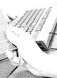
Apesar da queda do desemprego, a renda média dos brasileiros continuou fragilizada

ano. Apesar da queda do desemprego, a renda média dos brasileiros continuou fragilizada. Até maio, o rendimento real habitual do trabalho foi estimado em R$ 2.613, o que indica relativa estabilidade frente aos três meses anteriores (R$ 2.596).