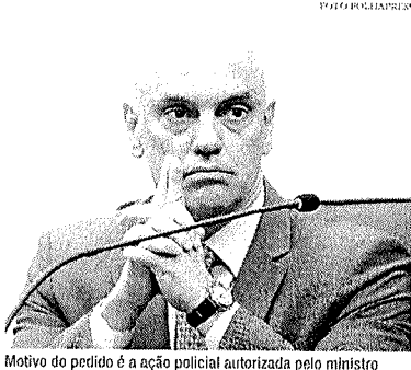
Motivo do pedido é a ação policial autorizada pelo ministro

A PGR informou nesta segunda-feira (26) que o documento, endereçado a Augusto Aras, está em tramitação interna. Em manifestação enviada a Moraes sobre o caso, a vice-procuradora-geral da República, Lindara Araújo,