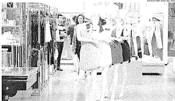
O maior recuo foi nas vendas de tecidos, vestuário e calçados (-17,1%)

O mês de abril foi o último com crescimento. Desde então, maio, junho e julho acumulam recuo de 2,7%. Por conta desses resultados, o setor se encontra praticamente no mesmo nível do