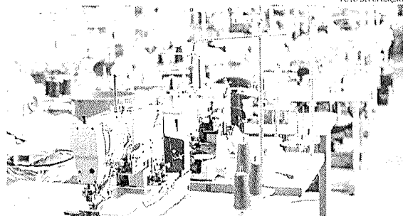
Conforme a Cepal, o crescimento da economia brasileira ficará abaixo da média regional no próximo ano

A economia brasileira deverá crescer mais que o inicialmente previsto este ano, mas desacelerará a partir do próximo ano, divulgou a Comissão Econômica para a América Latina e o Caribe (Cepal). Neste ano, o Produto Interno Bruto (PIB, soma dos bens e serviços produzidos no país) crescerá 2,6%, contra estimativa anterior de 1,6%. Em 2023, o Brasil deverá crescer 1%, no mesmo ritmo da Argentina. Uma das cinco comissões econômicas regionais das Nações Unidas, a Cepal revisou as projeções para 2022 para as economias da latino-americana e caribenhas, apresentadas em agosto, e divulgou as estimativas para 2023. A economia da região se expandirá 3,2% este ano, contra previsão anterior de 2,7%. Para 2023, o crescimento ficará em apenas 1,3%. Conforme as estimativas da Cepal, o crescimento da economia brasileira ficará abaixo da média regional no próximo ano. Na América do Sul, o Brasil só deverá registrar desempenho melhor que o Chile, cuja economia deverá se expandir 0,9% no próximo ano.