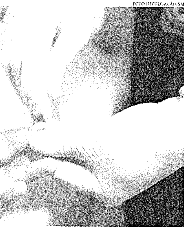
Há disponibilidade de vacinas de hepatite A para crianças e de hepatite B para qualquer faixa etária

Marcos Paiva pontua que há 5 tipos básicos de hepatite: A, B, C, D e E. Porém,