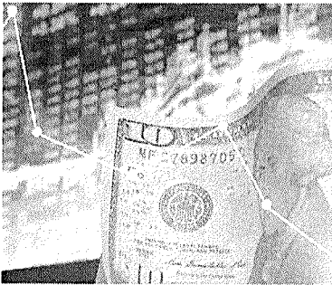
Dólar comercial fechou em alta de 1,27%, cotado a R$ 5,3120 na venda

As ações preferenciais da estatal petrolífera despencavam 3,08%. O Banco do Brasil, outra empresa com peso na Bolsa e que é con-