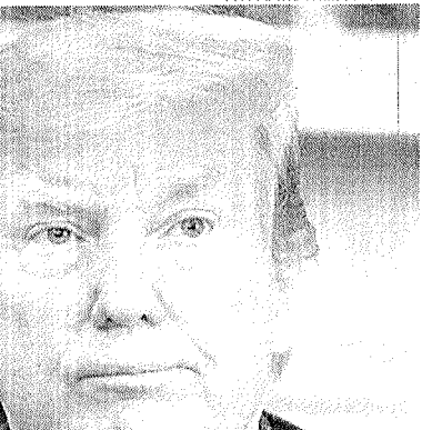
O ex-presidente nega as acusações e ainda deve recorrer da decisão do júri

De acordo com a mídia internacional, a Justiça Civil a vítima precisa provar com evidências que é provável que o acusado tenha cometido o abuso sexual. Caso fosse um julgamento criminal, seria necessário apresentar provas que não