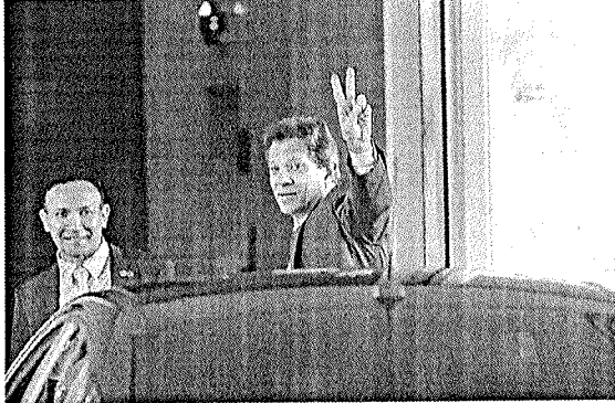
O ministro da Fazenda, Fernando Haddad, afirmou que a melhora significa "um passo importante" e cobrou Banco Central

O dólar e a Bolsa já vinham sendo impactados pela melhora nas expectativas sobre a economia brasileira nas últimas semanas, especialmente em relação ao PIB e à inflação do país, que surpreenderam pos-