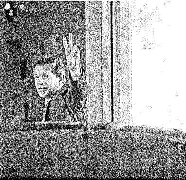
O ministro da Fazenda, Fernando Haddad, afirmou que a melhora significa "um passo importante" e cobrou Banco Central

Dólar e a Bolsa já vinham sendo impactados pela melhora nas expectativas sobre a economia brasileira nas últimas semanas, especialmente sobre o PIB e inflação do país, que surpreenderam positivamente o mercado.