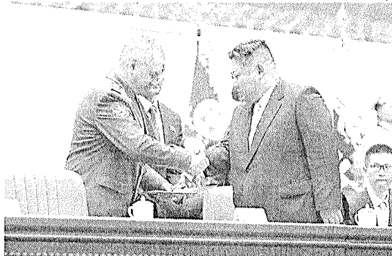
O Conselho de Segurança alertou que as discussões sobre armas estão "avanzando ativamente"

Após uma série de rumores sobre um suposto planejamento de que o presidente russo, Vladimir Putin, viajaria até à Coreia do Norte para negociar armas com o ditador Kim Jong-un serem divulgados pelo governo dos Estados Unidos. Nesta terça-feira, 05, o porta-voz do Kremlin, Dmitry Peskov, se negou a confirmar o assunto. "Não, não podemos [confirmar], não temos nada a dizer sobre o tema", disse. Conforme a Casa Branca, Putin participaria de tal encontro para falar sobre a venda de armas de Pyongyang para utilização de tais equipamentos na guerra da Ucrânia.