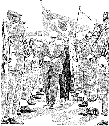
O presidente Lula tem compromissos a cumprir no continente africano até o dia 27 de agosto

Além de participar do encontro do Brics, o presidente brasileiro cumprirá outras agendas no continente africano nos próximos dias. Na sexta-feira, 25, o líder político irá à Angola, onde terá uma reunião privada e outra ampliada com o presidente João Lourenço. De acordo com o embaixador