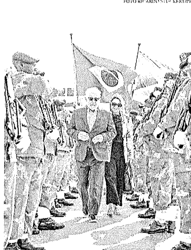
O presidente Lula tem compromissos a cumprir no continente africano até o dia 27 de agosto

Além de participar do encontro do Brics, o presidente brasileiro cumprirá outras agendas no continente africano nos próximos dias. Na sexta-feira, 25, o líder político irá à Angola, onde terá uma reunião privada e outra ampliada com o presidente João Lourenço. De acordo com o embaixador