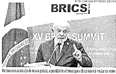
Mesmo com o adesão de novos países, o presidente afirmou que o Brics não irá mudar de nome.

O presidente negou tal possibilidade, mas reforçou a importância de tais nações no cenário geopolítico mundial. "São três países que não podem estar fora de qualquer agrupamento político que você queira fazer. Seja para discutir economia, ciência e tecnologia ou cultura. Essa gente tem que estar participando e outros países irão participar porque têm muito a oferecer", afirmou. Especificamente sobre o Irã, Lula disse estar feliz