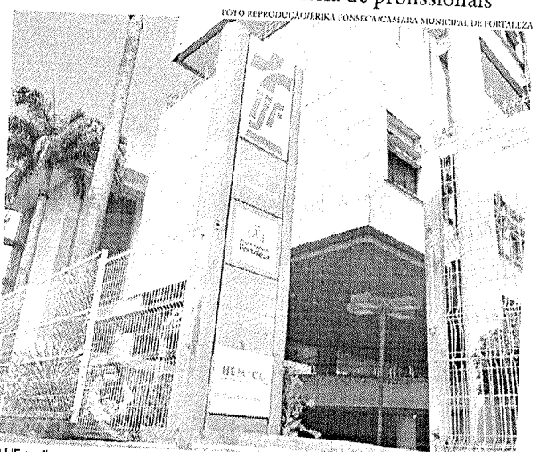
O IJF confirmou o recebimento da demanda do MPCE e garantiu que a responderá no prazo indicado

No último mês de novembro, o Coren-CE relata ter realizado a mais recente fiscalização no hospital, consi-