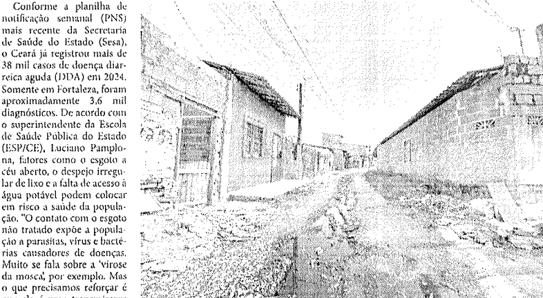
O contato com ambientes contaminados expõe a população a parasitas, vírus e bactérias

O Ceará, atualmente, passa por obras de esgotamento sanitário que devem beneficiar mais de 4 milhões de pessoas em diferentes municípios até 2033