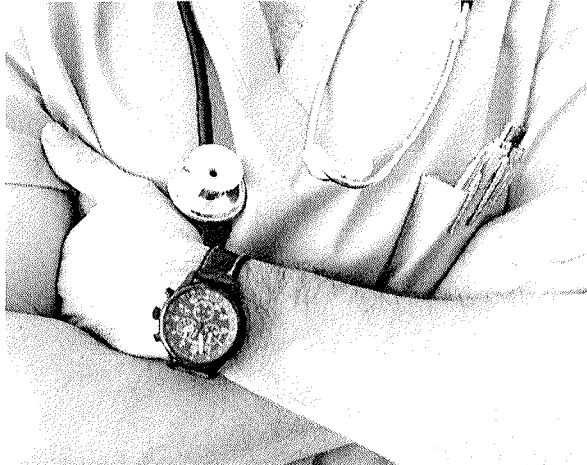
Durante a dita estação, a demanda das unidades de saúde aumenta, o que estaria piorando o problema