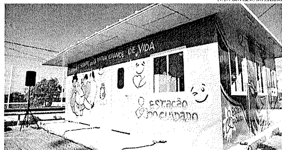
O novo equipamento é voltado para atender a pessoas em situação de rua e com problemas relacionados ao uso abusivo de álcool e outras drogas

em situação de rua, aqui no Moura Brasil. Agradecer esse trabalho e o pessoal do Estado, o acolhimento à PopRua, dando oportunidades a esse pessoal que está em superação de rua", pontuou. A Estação já está funcionando, de segunda a sexta-feira, das 8h às 17h; e aos sábados, das 8h às 12h. O espaço está localizado próximo à Santa Casa de Misericórdia (rua Senador Pompeu, 300, Moura Brasil), e vai atender, prioritariamente, a população do entorno.