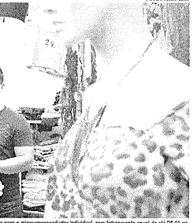
A finalidade é incentivar o acesso a crédito para o microempreendedor individual, com faturamento anual de até R$ 81 mil

O Programa de Simplificação do Microcrédito Digital para Empreendedores (SIM Digital) foi sancionado pelo governo sem vetos. A iniciativa foi criada para promover o acesso ao crédito e a ampliação dos mecanismos de garantia para a concessão de microcrédito produtivo para empreendedores. Na prática, o projeto altera a gestão e os procedimentos de recolhimento do Fundo de Garantia do Tempo de Serviço (FGTS). Dessa forma, permite que o recolhimento seja usado para a aquisição de cotas do Fundo Garantidor de Microfinanças (FGM), para viabilizar as operações de crédito. O fundo não disporá de qualquer tipo de garantia ou aval por parte da União. Com isso, as operações de microcrédito do SIM Digital terão taxa de juros reduzidas e prazo máximo de 24 meses; que a linha de crédito é de R$ 1.500 para pessoa que exerça atividade produtiva urbana ou rural, e R$ 4.500 para o Micro Empreendedor Individual (MEI). De acordo com o texto, as operações devem ser destinadas, preferencialmente, a mulheres. A finalidade é incentivar o acesso ao crédito para o microempreendedor individual, com faturamento anual de até R$ 81 mil; microempresários, com faturamento até R$ 360 mil e pequenos empresários, faturamento entre R$ 360 mil e R$ 8 milhões. Além disso, o programa busca incentivar a formalização e a inclusão previdenciária de microempreendedores de baixa renda. De acordo com a secre-