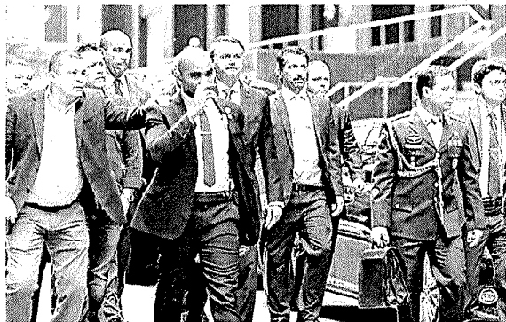
O presidente Jair Bolsonaro em viagem aos EUA. De farda verde o ajudante de ordens tenente-coronel Mauro Cid

O material analisado pela Polícia Federal indica que as movimentações financeiras se destinavam a pagar contas pessoais da família presidencial e também de pessoas próximas da primeira-dama, Michelle Bolsonaro. A assessoria da Presidência nega qualquer irregularidade nas transações e diz que os valores movimentados têm como origem a conta particular do presidente da República.