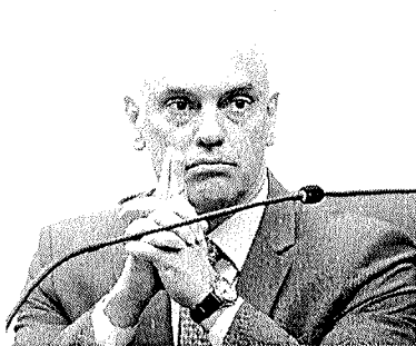
Motivo do pedido é a ação policial autorizada pelo ministro

A PGR informou nesta segunda-feira (26) que o documento, endereçado a Augusto Aras, está em tramitação interna. Em manifestação enviada a Moraes sobre o caso, a vice-procuradora-geral da República, Lindora Araújo,