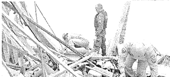
Todos os feridos do primeiro acidente estavam dentro do estabelecimento no momento do desabamento

No mesmo dia, durante a tarde, uma casa desabou em Iguatu, no bairro Santa Antônia, deixando outras três pessoas feridas, sendo duas mulheres de 50 e 55 anos, e uma adolescente. A adolescente e a mulher mais nova estavam