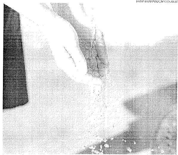
Poços profundos ou artesianos estão presentes em 10,3% dos domicílios cearenses

É importante destacar que a rede geral de distribuição foi o modo de abastecimento de água mais encontrado no Estado, utilizado por 78,8% dos cearenses. O índice, porém, se manteve abaixo da média nacional, de 82,9%, mas acima da média da Região Nordeste, de 76,3%. Entre os estados nordestinos, o Ceará aparece atrás do Rio Grande do Norte (84,6%), de Sergipe (85,3%) e da Bahia (82,7%). O percentual de pessoas que utilizam a rede geral de distribuição foi maior do que o encontrado em Alagoas (67,7%), Pernambuco (70,6%), na Paraíba (74%), no Piauí (76,9%) e Maranhão (65,3%).